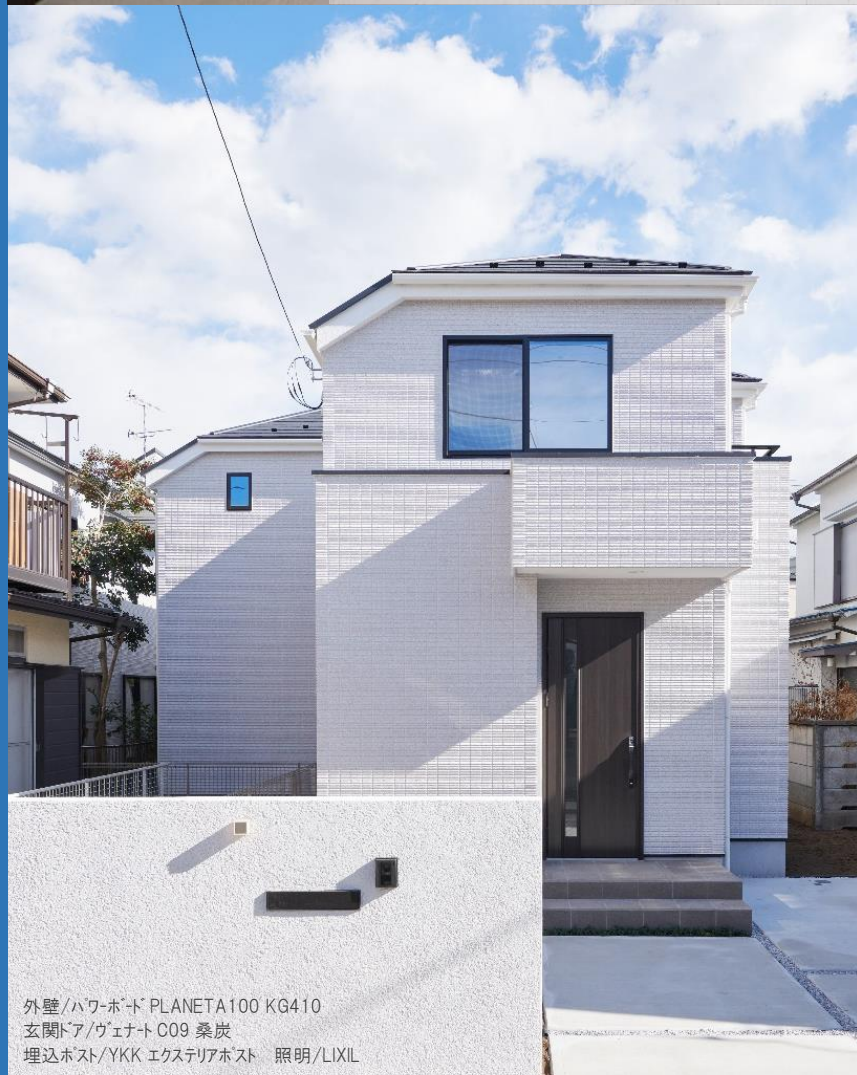
外壁/ハウボート PLANETA100 KG410 玄関ドア/ヴェナト C09 桑炭 埋込ポスト/YKK エクステリアポスト 照明/LIXIL