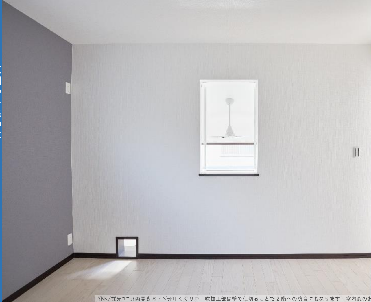
YKK/採光ユニット両開き窓・ペット用くぐり戸 吹抜上部は壁で仕切ること2階への防音にもなります 室内窓のある風景も素敵です