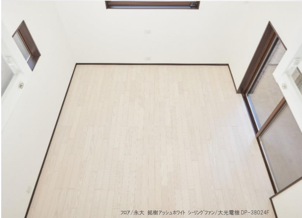
フロア/永大 銘樹アッシュホワイト シーリングファン/大光電機 DP-38024F